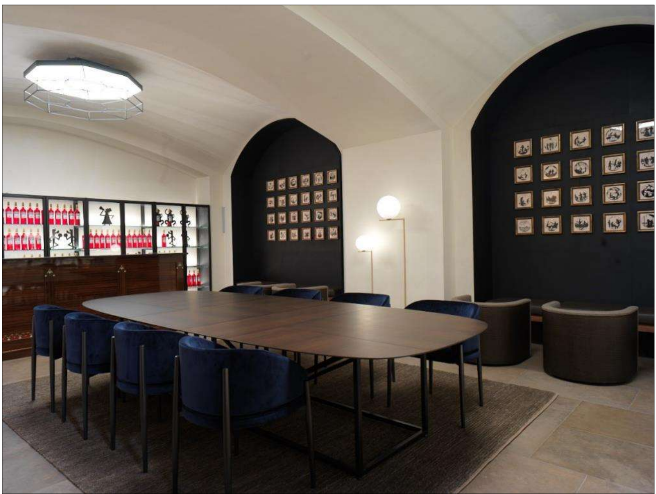
Lunch/Dinner VIP Set-up or Meeting Set up